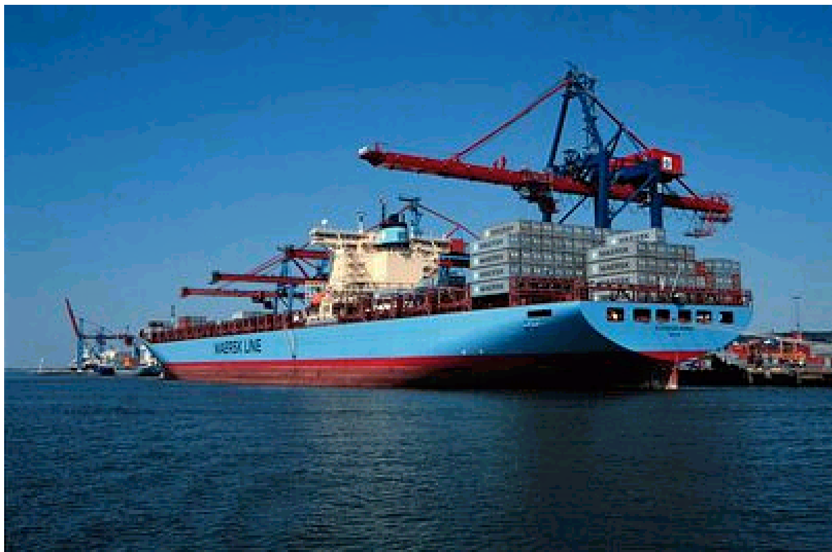
Figur 1: The Sovereign Maersk tillhör världens största containerfartyg och är en regelbunden besökare i Göteborgs hamn. Den transporterar upp till 6600 containrar till och från fjärran östern.

Göteborg är på flera sätt ett centrum. Förutom att vara Sveriges andra största stad finns nordens största hamn här. Närmare en tredjedel av den svenska exporten passerar igenom hamnen (Göteborgs Hamn, 2003). Detta präglar de transporter som sker till, från och inom staden.